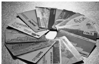
Grundversicherung – Zusatzversicherung Seite 6