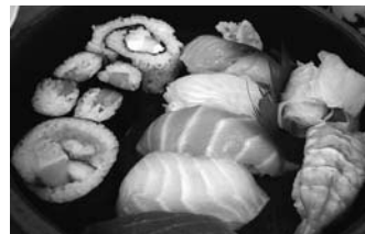
Sushi Japanischer Abend Seite 25