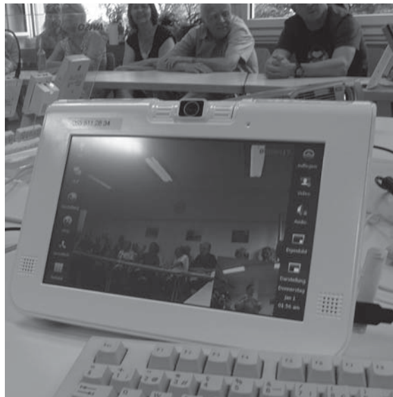
Das Gerät ViTAB in Funktion