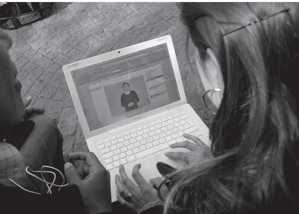
Die Gebärdensprache am Computer lernen