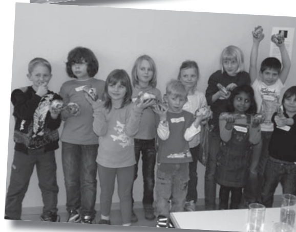
Stolz zeigen die Kinder ihre Produkte