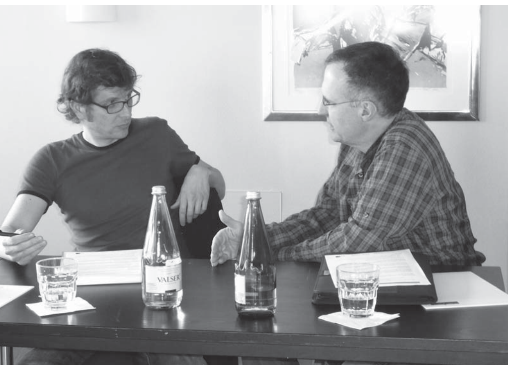
Anregende Gespräche zwischen den Teilnehmenden