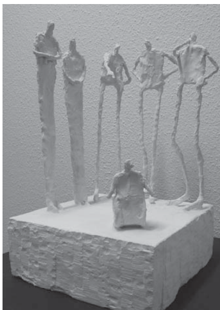
Einer der Gipsplastiken «Ferne trotz Nähe»

Im Gehörlosenzentrum fanden im letzten Jahr einige Veränderungen im Haus statt – wie unter anderem der Umbau von Stockwerk C des Schweizerischen Gehörlosenbunds SGB-FSS. Nun setzt sich der Schweizerische Gehörlosenbund SGB-FSS zum Ziel, vermehrt das Gehörlosenzentrum und damit natür-