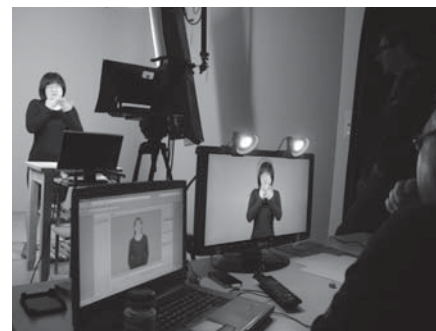
Studioaufnahme für das Online-Lexikon