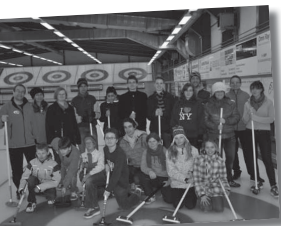
Erfolgserlebnis für alle

Viel Spass hatten am 5. März die 16 jugendlichen Hörbehinderten und zwei Begleitpersonen im Curling-Center Wallisellen. Der Audiopädagogische Dienst Zürich APD organisiert regelmässig Treffen für jugendliche Hörbehinderte, welche integrativ geschult werden.