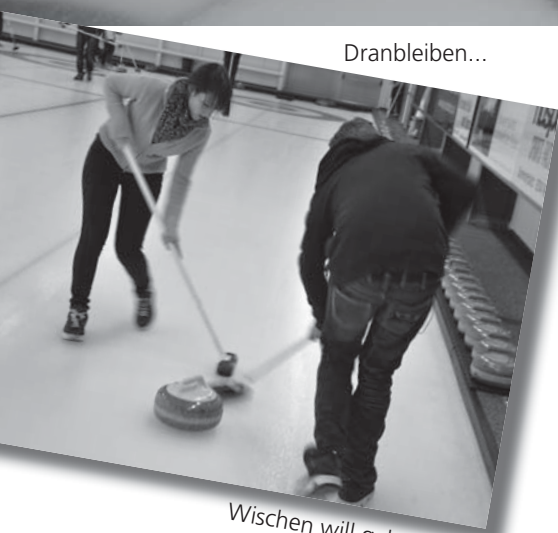
Wischen will gelernt sein