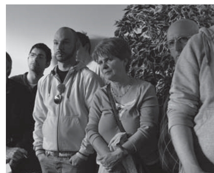
Interessierte Besucher und Zuhörer