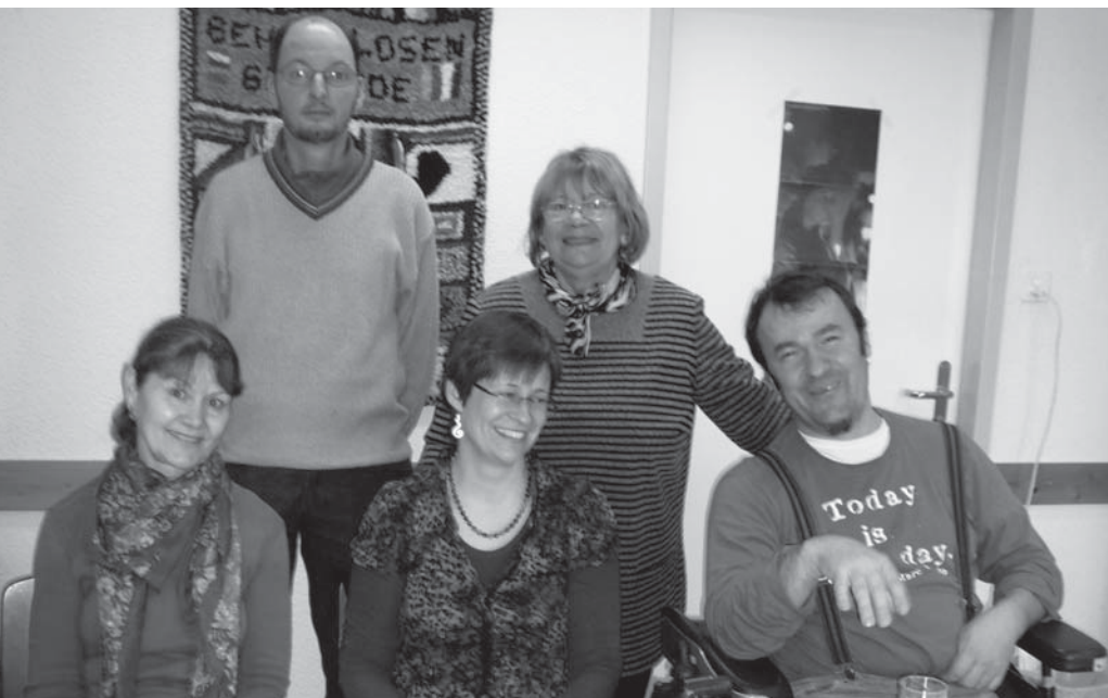
Freiwilligengruppe der Beratungsstelle für Gehörlose und Hörbehinderte Zürich

Die Beratungsstelle für Gehörlose und Hörbehinderte führt seit ca. 38 Jahren eine Freiwilligengruppe mit unterschiedlicher Anzahl Personen, die freiwillig Zeit schenken für Gehörlose oder Schwerhörige.